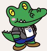
阪大「ワニ博士」経済学部の頃