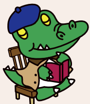
阪大「ワニ博士」文学部の頃