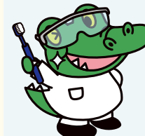
阪大「ワニ博士」歯学部の項