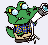
阪大「ワニ博士」理学部の頃