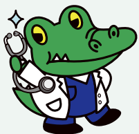
阪大「ワニ博士」医学部の項