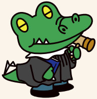
阪大「ワニ博士」法学部の頃