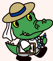
阪大「ワニ博士」人間科学部の頃