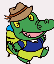
阪大「ワニ博士」外国語学部の頃