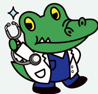
阪大「ワニ博士」医学部の項